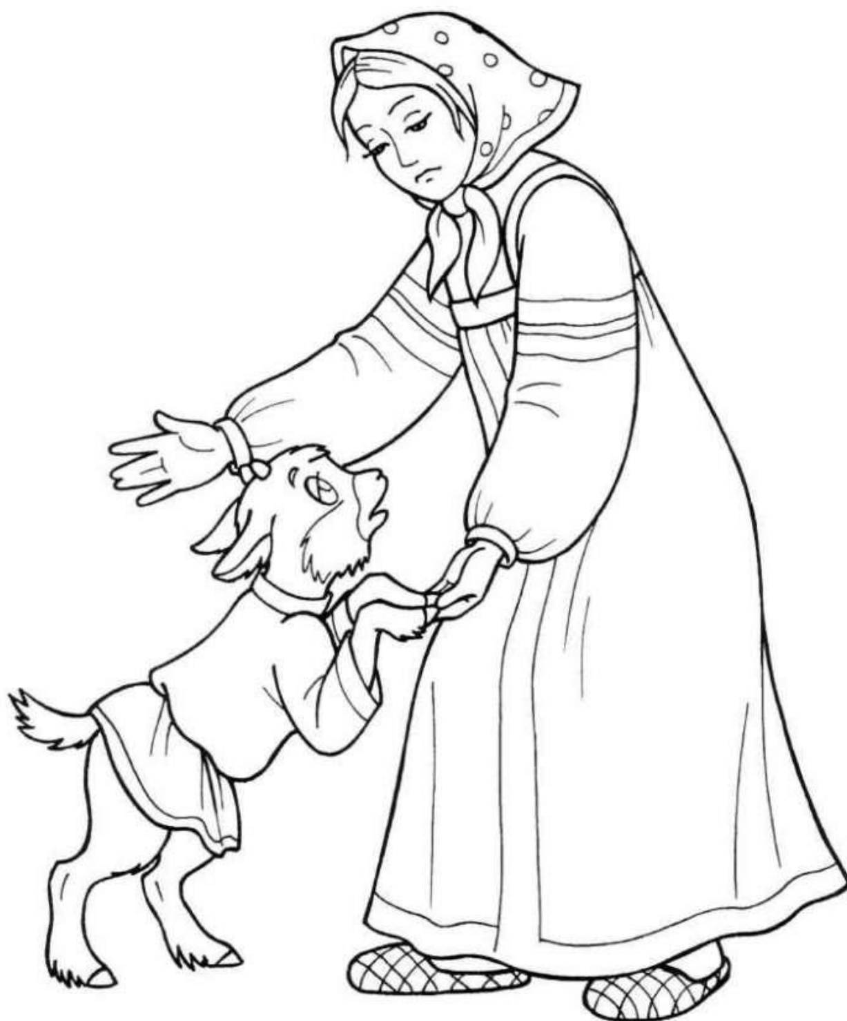
СЕСТРИЦА АЛЁНУШКА И БРАТЕЦ ИВАНУШКА